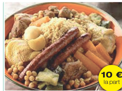
Couscous Agneau Volaille Merguez