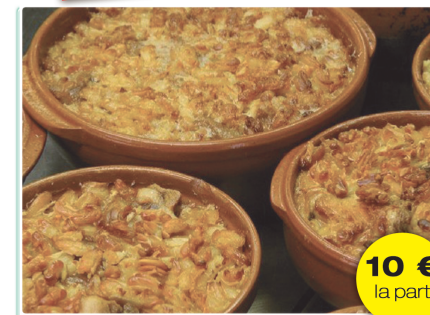
Cassoulet haricots blanc échine Lard confit de canard